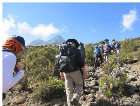
Auf 3800 m.ü.M.