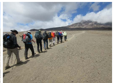
Auf 4600 m.ü.M.