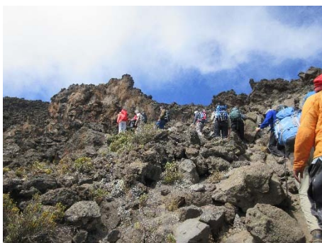
Impressionen: Auf 4500 m.ü.M.