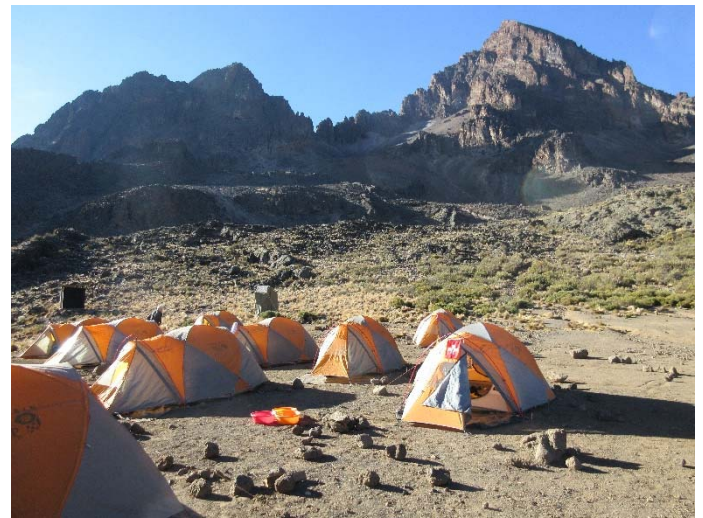
Zeltlager am Fuss des Nachbarbergs Mawenzi, auf 4300 m.ü.M.