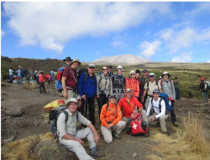
Auf 3600 m.ü.M. während des Aufstiegs, im Hintergrund der Kilimanjaro